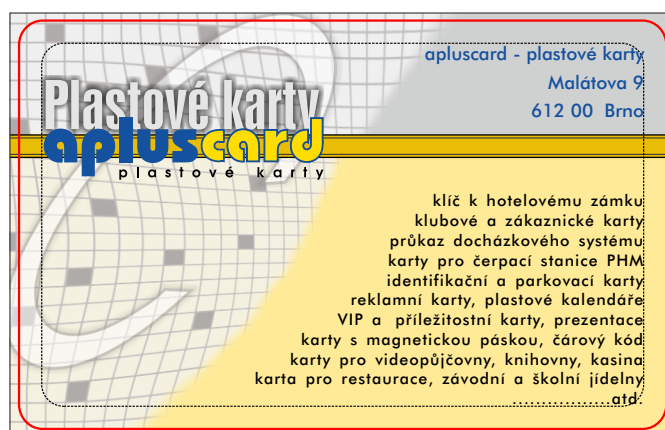
Výsledný produkt - plastová karta, rozměr ISO 85,6 x 54 mm

Žádný objekt s výjimkou pozadí by neměl být blíže než 3 mm od okraje čistého rozměru karty (85,6 x 54 mm). Vzhledem k toleranci tisku může dojít k drobnému posunu grafiky vůči hraně karty, což při menší vzdálenosti objektů od hrany působí rušivě. Pozadí (včetně grafických objektů) tištěné „na spad“ musí dosahovat až k okraji hrubého rozměru (88 x 56 mm). Pokud některý objekt přesahuje hrubý rozměr, musí být oříznut.